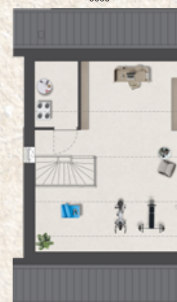
2e verdieping maatvoering is tot 150+ lijn