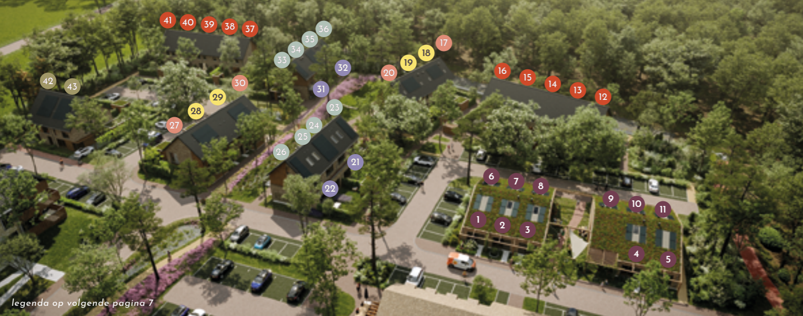
legenda op volgende pagina 7